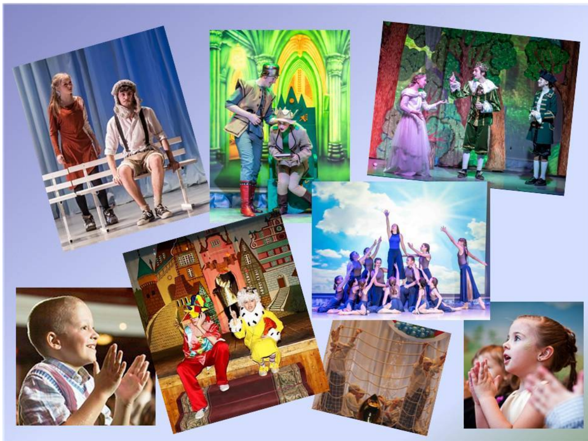
Фотоафиша спектаклей детских театральных коллективов Саратовской области

6. Костарева Е.В. КВН как комплексная форма внеурочной деятельности // Образовательная социальная сеть. – URL: https://nsportal.ru/shkola/vneklassnaya-rabota/library/2015/01/18/kvn-kak-kompleksnaya-forma-vneurochnoy-deyatelnosti .