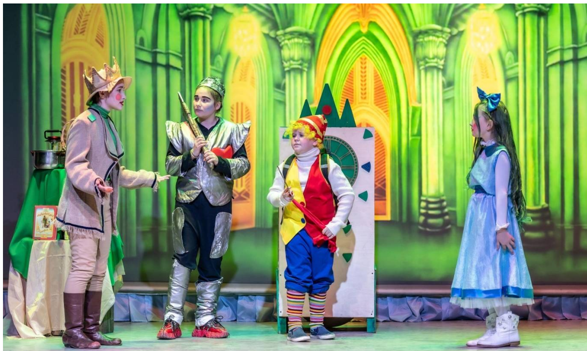
Спектакль «Буратино в Изумрудном городе» театра детского и юношеского творчества «Молодая гвардия» МАУ ДО «Дворец творчества детей и молодежи им. О.П. Табакова» г. Саратова

щемся мире. Речь идет о становлении новой педагогической парадигмы, нового мышления и творчества в образовательной сфере. Рождается школа «культуротворческого» типа, строящая единый и целостный учебный процесс как путь ребенка в культуру 4 .