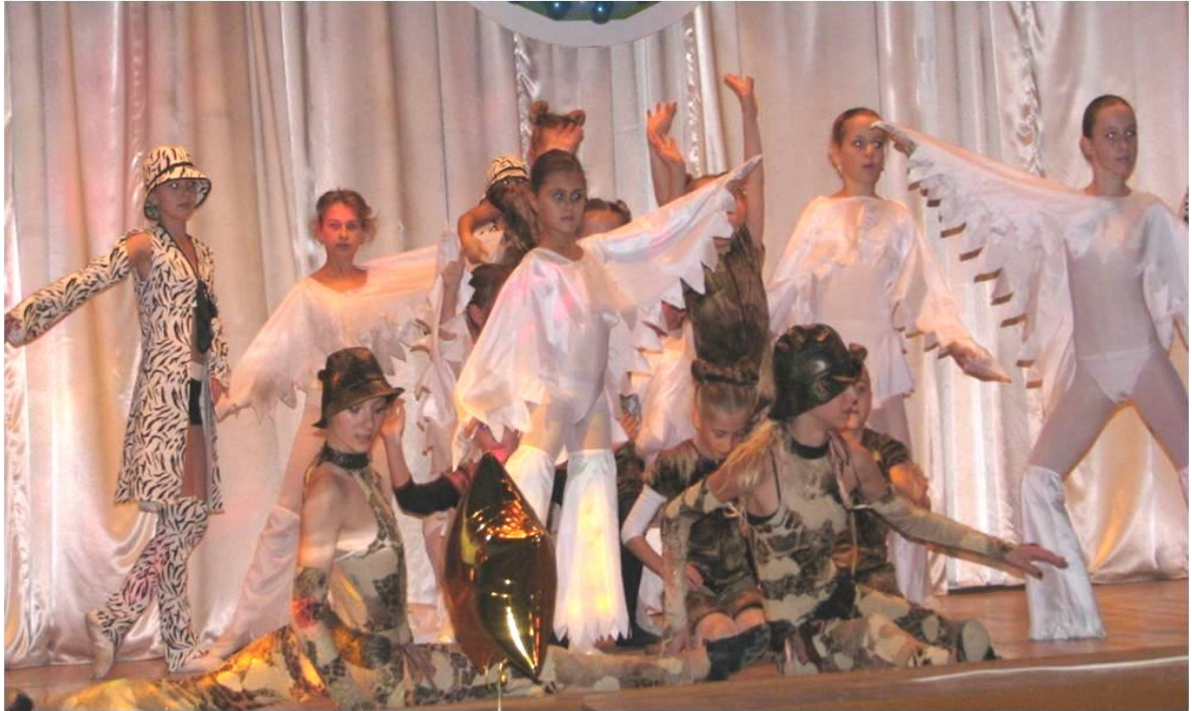
Театр танца «Домино» МАУ ДО «Дворец творчества детей и молодежи» Энгельского муниципального района

В процессе подготовки к выступлениям команды КВН происходит дальнейшее обучение и совершенствование профессиональных умений и навыков членов команды, развитие их творческих и мыслительных способностей, а также навыков как самостоятельной работы, так и совместной деятельности в команде. Особое внимание уделяется развитию актерских, пластических, импровизационных и литературно-речевых навыков. Огромное значение имеет воспитание преемственности в командах.