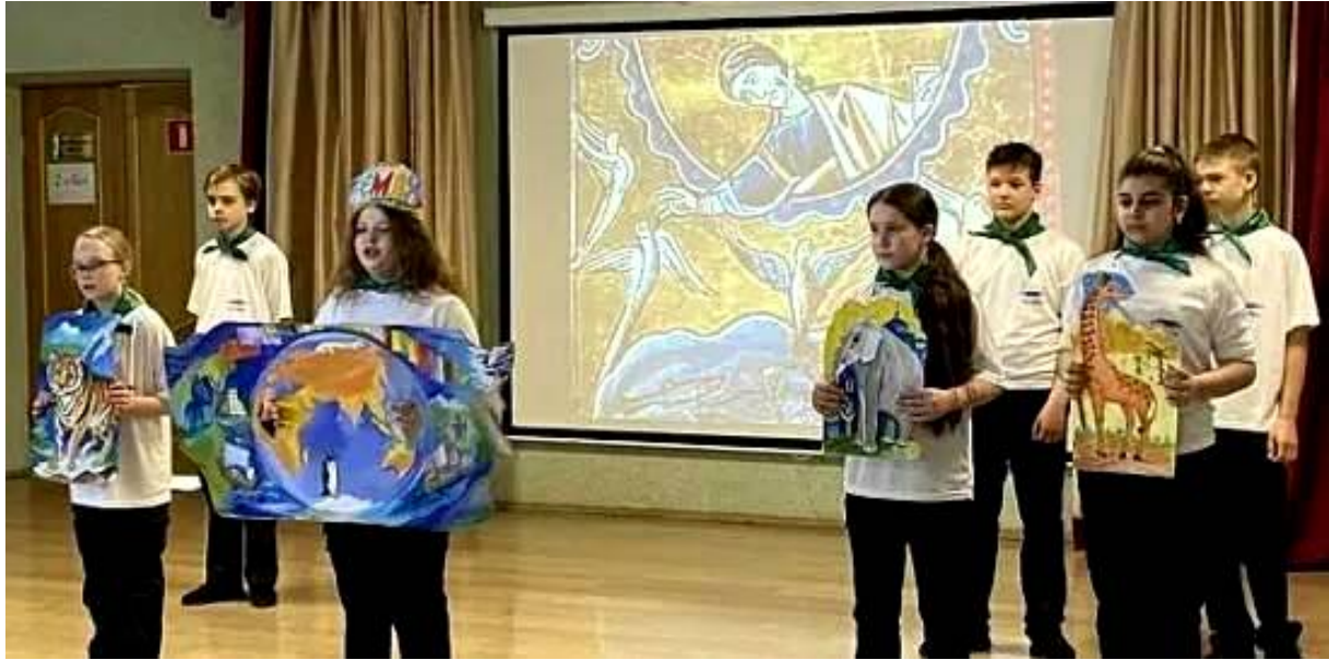
Театрализованное мероприятие «Берегите эту Землю!» МАУ ДО «Центр детского творчества «Созвездие-К» Кировского района г. Саратова